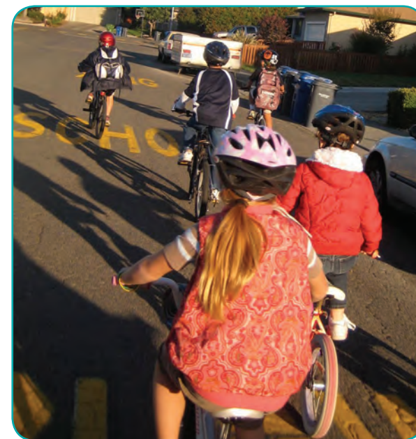
Estudiantes yendo en bici a la Escuela La Tercera en Petaluma en el Día de Andar o Rodar a la Escuela.

Para aprender más de Rutas Seguras a la Escuela, consulte www.sonomasaferoutes.org . Usted puede comunicarse con el personal de SRTS en saferoutes@bikesonoma.org o (707) 545-0153.